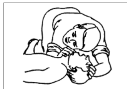
Rys. 3. Sprawdzanie słuchem, czy ratowany oddycha. Równocześnie obserwowanie, czy widoczne są ruchy oddechowe klatki piersiowej